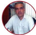
Repr. Comunidade Pedro Pena